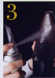
最後の仕上げは 防水スプレーを 降り注いでこご

ポニーなどの起毛素材や、ヘビなどのツヤ革は、水に強くないものが多いので、防水スプレーをしておくに間違いはない。「こういったエキゾチックレザーは、経年変化をしないものがほとんどです。防水スプレーで革を保護して、長持ちさせることを念頭におきましょう。【両足の作業時間=30分】