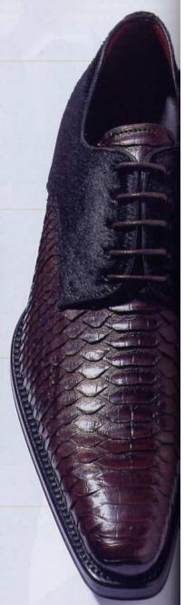
7万9500円 (ヘンダーソン/ ワールドフットウェア キー 神宮前本店)

今回は、ポニーとヘビ革のコンビ靴で実演を依頼しました。まずはポニー部分。「ポニーやアザラシなどの起毛素材は、毛の硬い豚毛ブラシでブラッシングを行い、コロリやヨミを落とすしていくのがお手入れの基本となります」。一定方向にブラッシングするのがコツ。【両足の作業時間=2分】