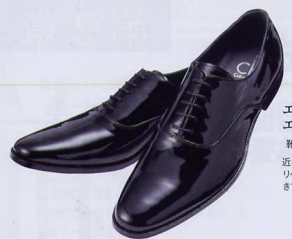
エナメルレザーのお手入れは エキゾチックレザーと同じ 靴2万9400円(ok カルビノ・クライシ) 近年、増加しているエナメル加工された靴。光沢感が命であるこの素材のデリケートさは、エキゾチックレザーと同じレベル。汚れ落としは、基本的に拭きでいい(汚れがひどい場合は絞った布でも可)。防水スプレーで仕上げ。