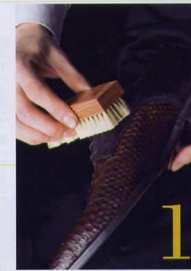
毛足の長いレザーは 豚毛ブラシでの ブラッシングが命

次はヘビ革の汚れ落とし。「ヘビやワニなど、ツヤのあるエキゾチックレザーは、水を使わないほうが無難。乾いた布での拭き取りがメインとなります」。加工方法によってもお手入れの仕方が異なるので、から拭きで取れない場合は、購入したお店に相談する。【両足の作業時間=1分】